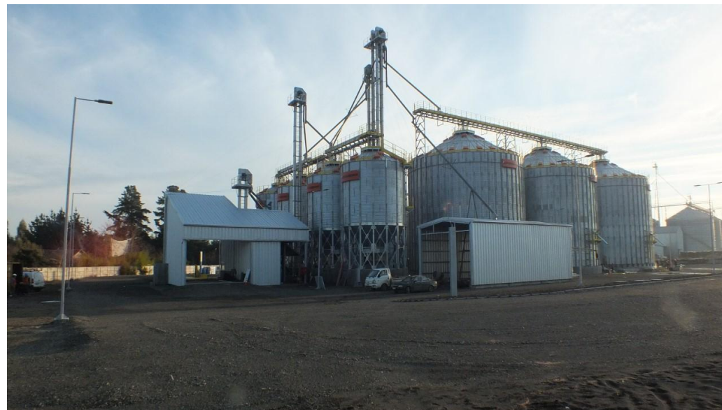
Planta de silos Los Ángeles.